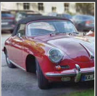
PRÄSENTATIONEN & MESSEN

Bankettbüro für Termin-, Menü- und Raumanfragen: Tel 0651-1444-379 Mo. - Fr. von 9 - 15 Uhr bankett@nellsarkhotel.de Mehr Info/Bilder: www.nellsarkhotel.de