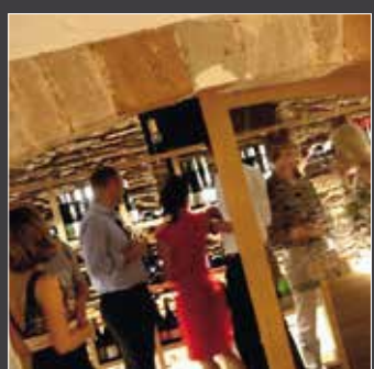
WINE & DINE