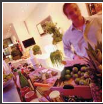
COCKTAILS FÜR IHRE FEIER