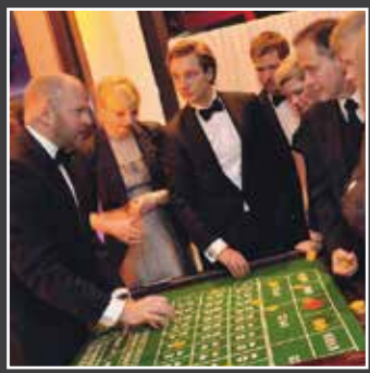
CASINO ROYAL NIGHT