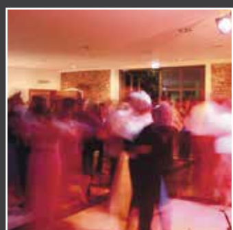
TANZEN BIS IN DIE PUPPEN